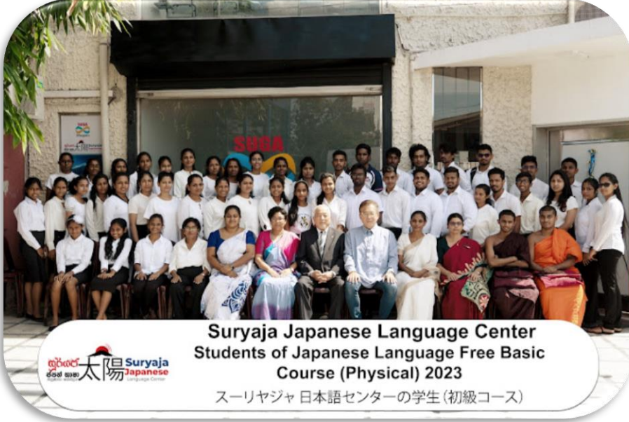
Suryaja Japanese Language Center Students of Japanese Language Free Basic Course (Physical) 2023 スーリヤジャ 日本語センターの学生 (初級コース)